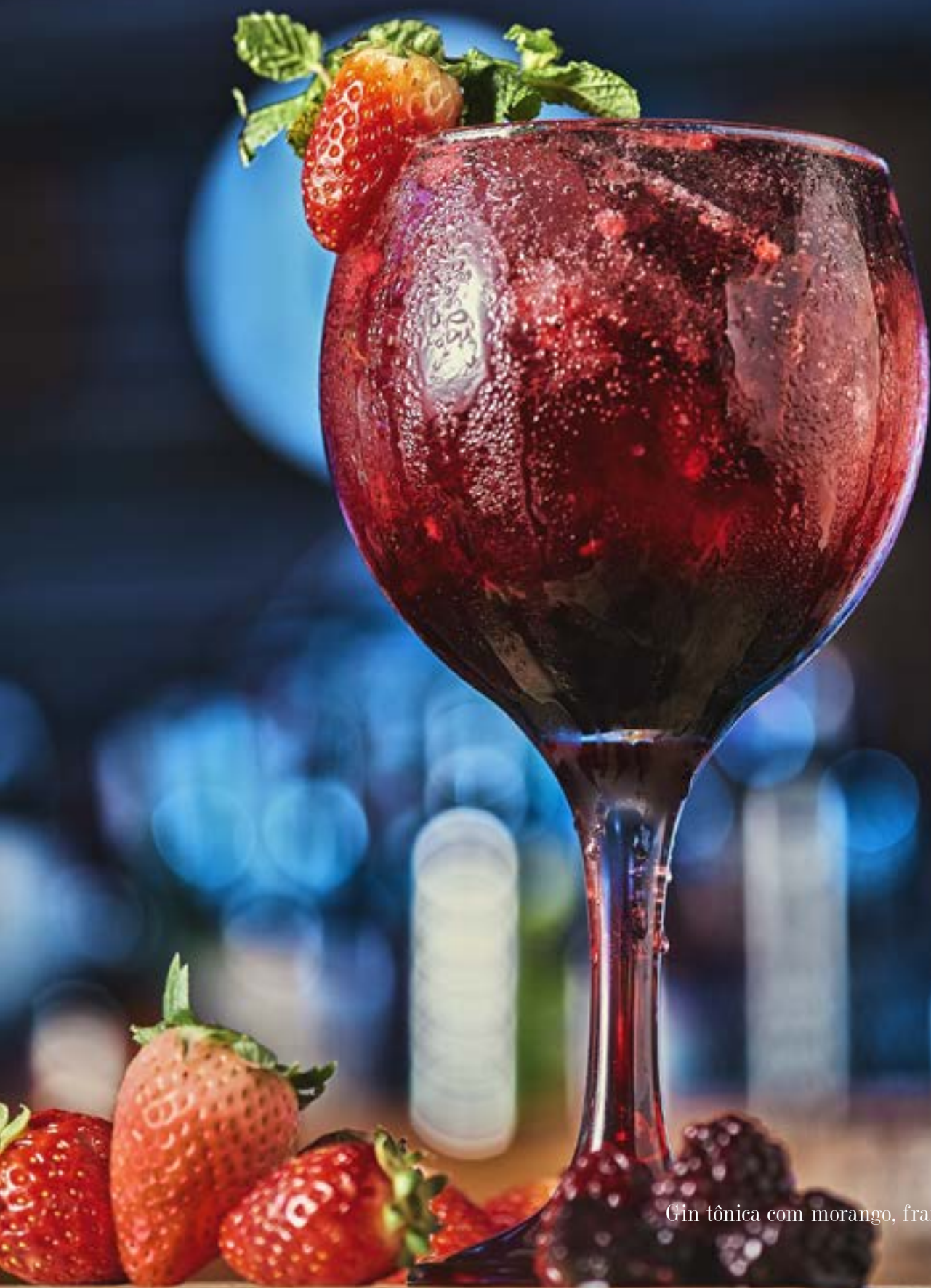
Gin tônica com morango, framboesa e amora