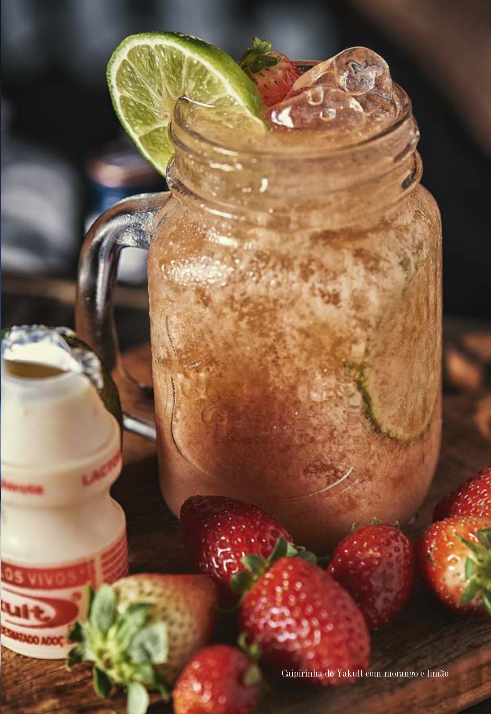
Caipirinha de Yakult com morango e limão