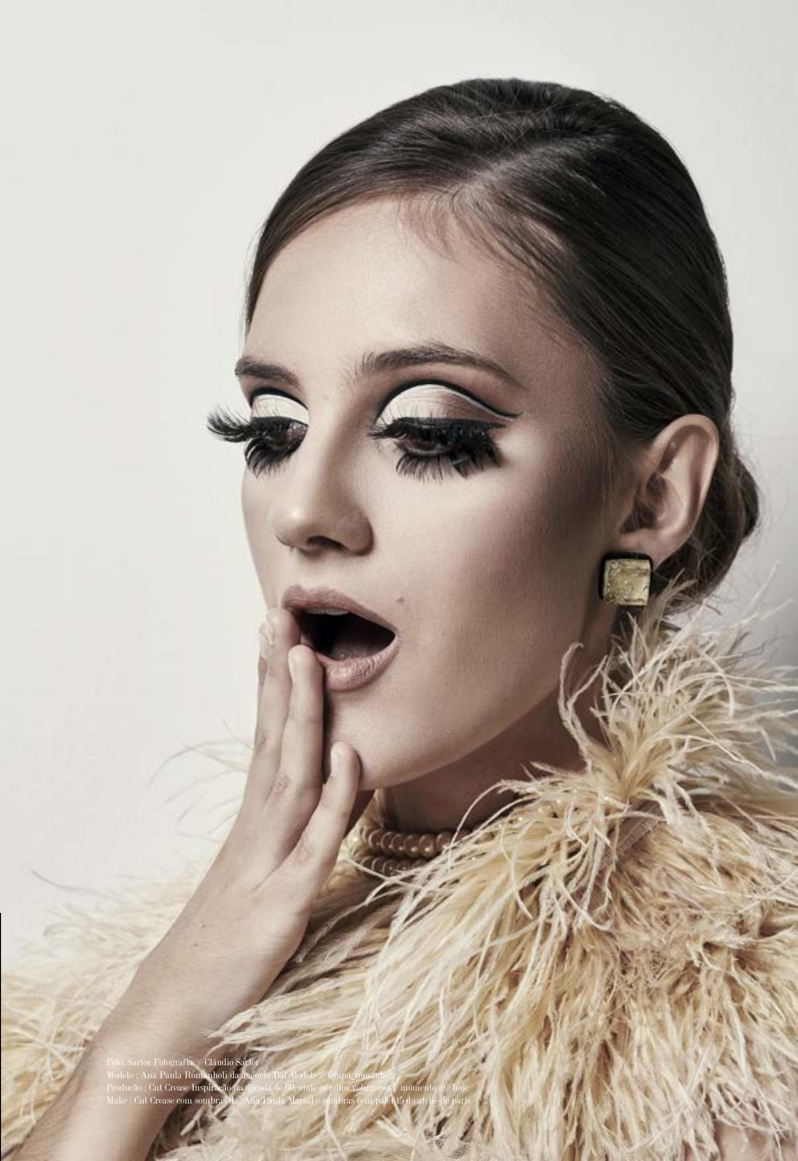
Modelo: Ana Paula Romanholi da agência Daf Models / @ana_romanholi Produção: Cut Crease Inspiração na década de 60, onde os cílios volumosos é momento até hoje Make: Cut Crease com sombras da Ana Paula Marsal e sombras com palet t5 do ateliê de paris