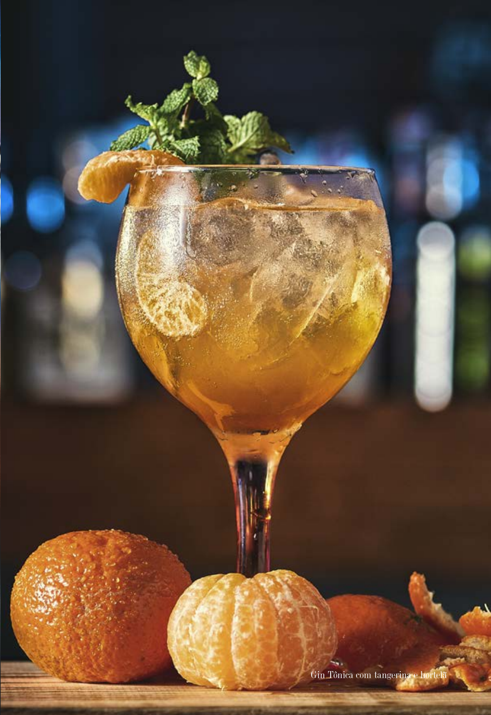
Gin Tônica com tangerina e hortelã